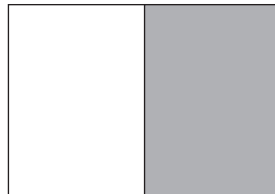
1/2 Seite hoch